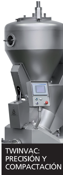
TWINVAC: PRECISIÓN Y COMPACTACIÓN

Soluciones RFID "llaves en mano" para la industria cárnica.