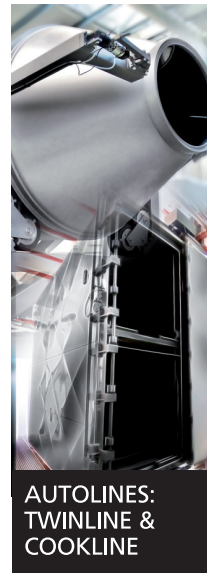
AUTOLINES: TWINLINE & COOKLINE

Ha renacido una estrella: la inyección y el marinado por efecto spray reinventados.